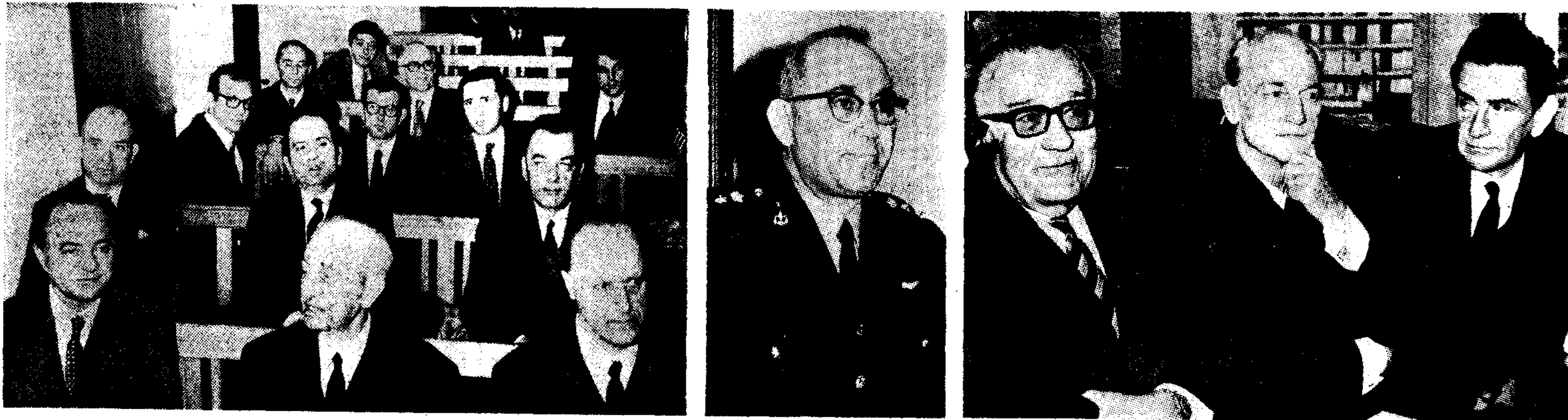
Τρία στιγμιότυπα από την έναρξη της συνεδρίασης του έκτακτου στρατοδικείου 'Αθηνών.